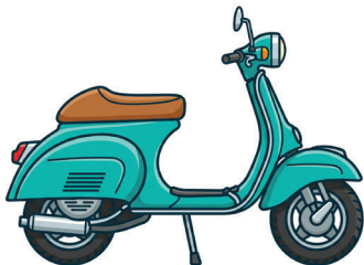
СКУТЕР / МОПЕД

До 50 см 3 , до 50 км/ч – категория М с 16 лет.