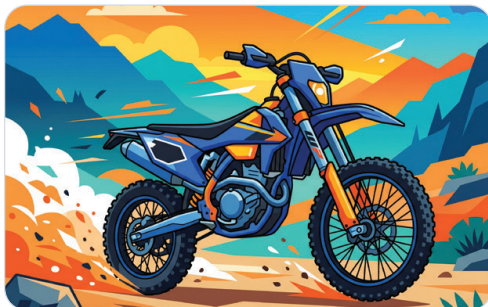
ЭНДУРО / МОТОЦИКЛ

На тротуаре и в пеш. зонах – запрещено. ОСАГО не требуется.