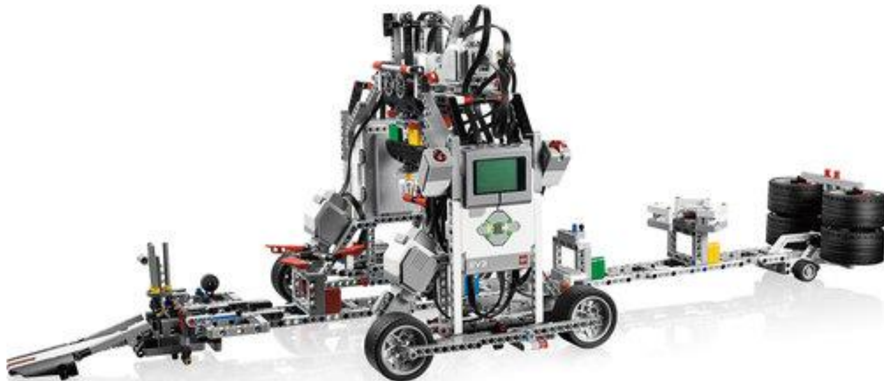
Модель «Фабрика спиннеров», собранная из набора Lego Mindstorms EV3