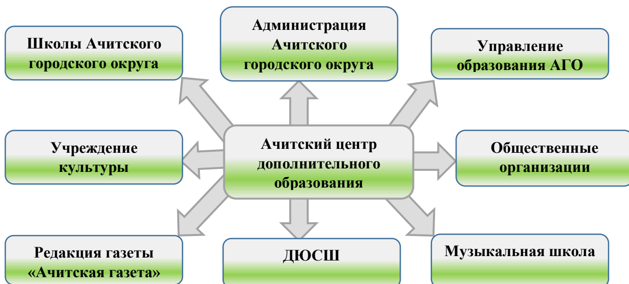
Схема взаимодействия ЦДО: