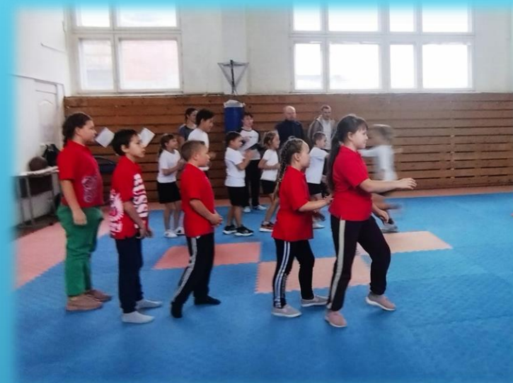
ОФП и игровые виды спорта